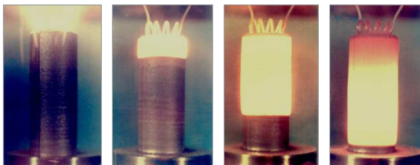
Рис. 5 Фото СВС-процесса: распространение волны твердопламенного горения (реакция Ti + V )

дые продукты — не газы, как, например, при горении угля и ракетных топлив, а твердые вещества. Это были смеси порошков металлов (Ti, Zr, Hf, V, Nb, Ta и др.) и неметаллов (B, C и Si), образующих тугоплавкие вещества: бориды, карбиды, силициды.