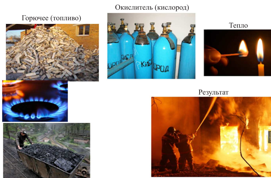
Рис. 1 Что нужно для горения

Чтобы получился огонь, нужны три вещи (рис. 1):